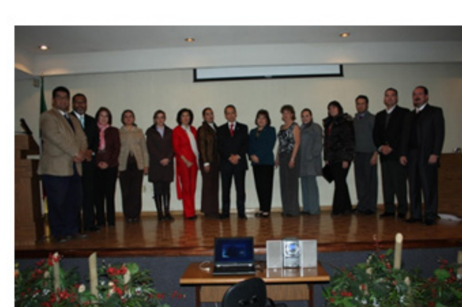
Inicio del Doctorado en Comunicación Aplicada