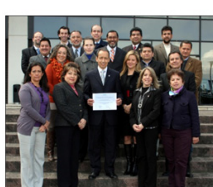
Equipo de la Facultad de Comunicación

Actualmente el Doctorado cuenta con veinte alumnos que integran las dos primeras generaciones y se consideran parte de los investigadores que pueden incorporarse a los proyectos del CICA (Centro de Investigación para la Comunicación Aplicada) con la intención de promover el uso ético de los medios de comunicación para crear una sociedad más justa, solidaria, promotora del bien común y el desarrollo de la persona.