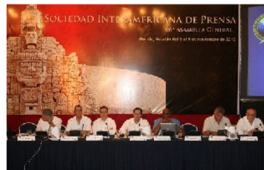
66° Asamblea General de la SIP

Como hace dos años, todas las escuelas acreditadas ante CLAEP están invitadas a participar. Les recomendamos reservar dicha fecha para poder asistir a este evento.